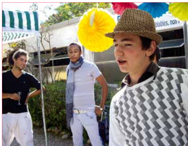
Trois des jeunes actuellement présents au Foyer.